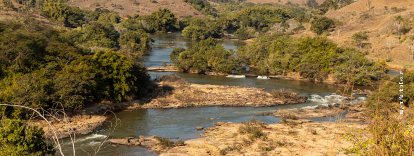
Imagem: Maurício Decourt